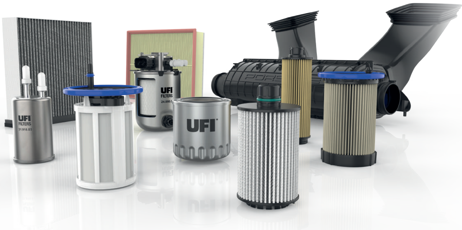
Cikkszám példák a Bárdi Autó Ufi szűrő kínálatából:

De nemcsak a legmodernebb típusok kerülnek fókuszba: nagy hangsúlyt fektetnek a régóta ismert európai márkák mellett a távol-keleti típusokhoz szükséges alkatrészek fejlesztésére is. Ez azt jelenti, hogy bármilyen, hazánkban futó típushoz keres UFI szűrőt, a Bárdi Autó kínálatában megtalálja a megfelelő terméket.