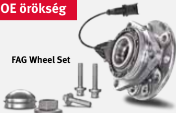
FAG Wheel Set