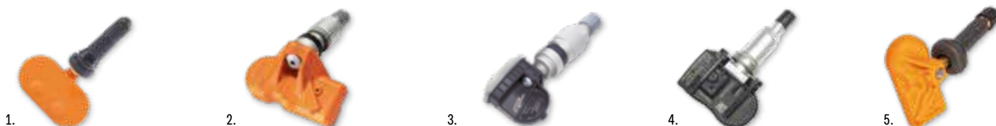
Cikkszám példák a Bárdi Autó univerzális és előre programozott szenzor kínálatából:

A feltüntetett árak 2019.03.01. és 2019.03.31. között érvényesek vagy a készlet erejéig.