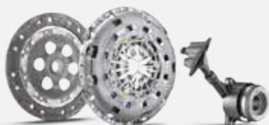
LuK RepSet Pro