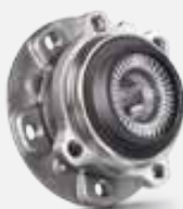
FAG Wheel Set