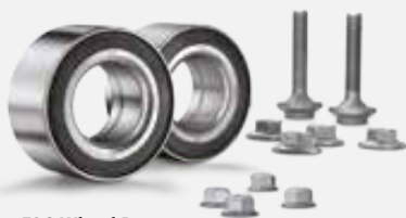
FAG Wheel Pro