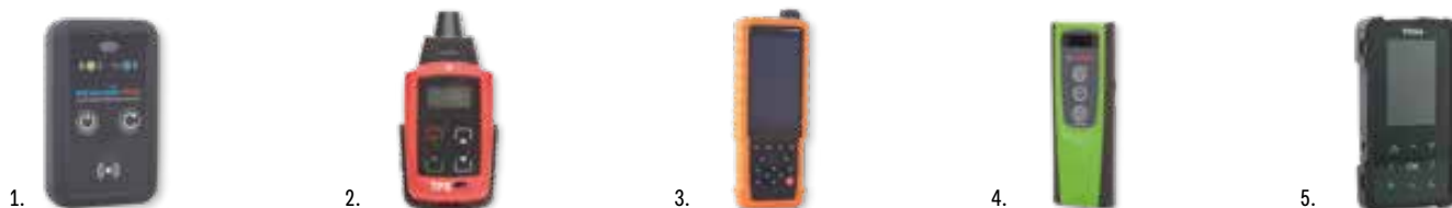
Cikkszám példák a Bárdi Autó TPMS műszer kínálatából: