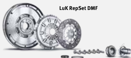
LuK RepSet DMF